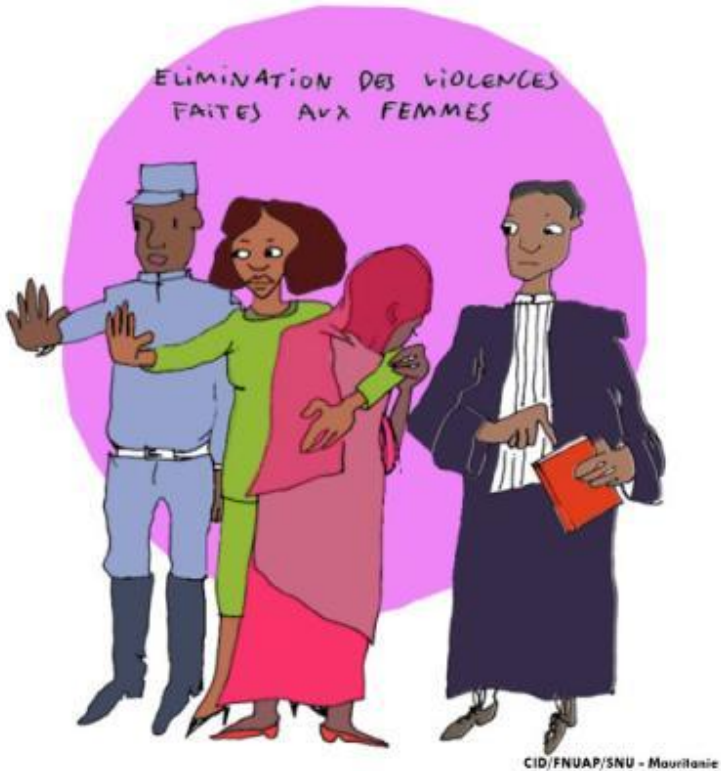
CID/FNUAP/SNU - Mauritanie